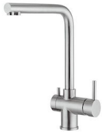
Mischbatterie Gamma 3 Wege - satiniert 8496 100