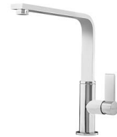
Mischbatterie NYC 8486 000