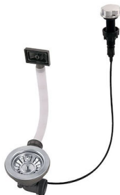
Automatischer Abfluss 8407 100