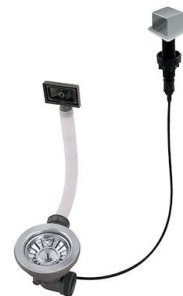
Automatischer Abfluss LIRA 8407 103